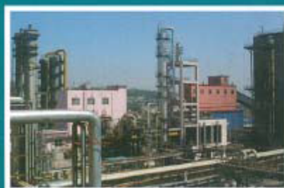
焦炉化产回收系统