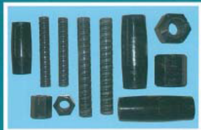
预应力混凝土用精轧螺纹