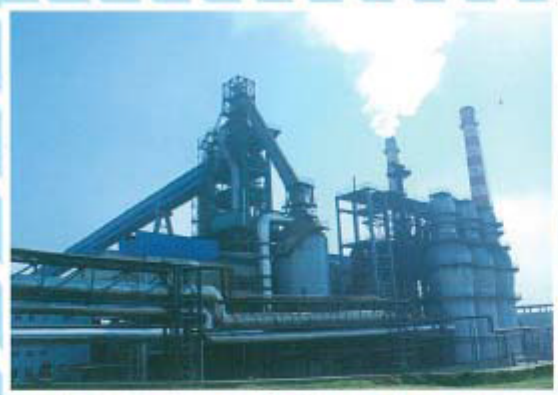
国内先进水平高炉炼铁生产线

MODERNIZED IRON MAKING SYSTEM AND STEEL MAKING SYSTEM