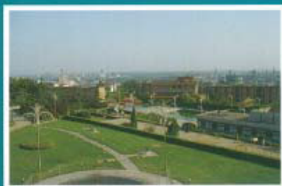
环境优美的生活区一角