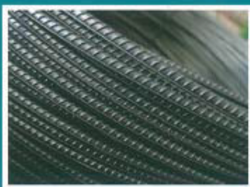
热轧带肋钢筋盘条