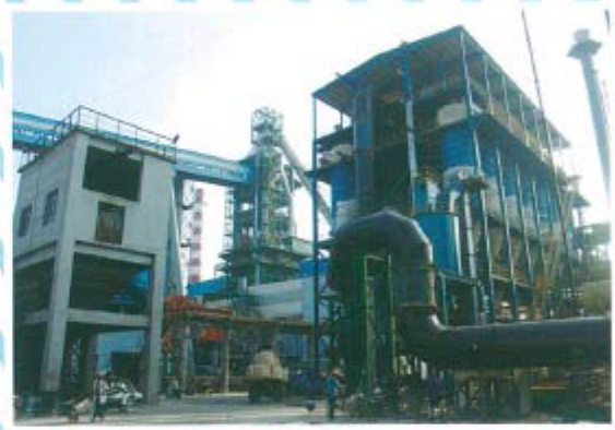
高炉干法除尘系统