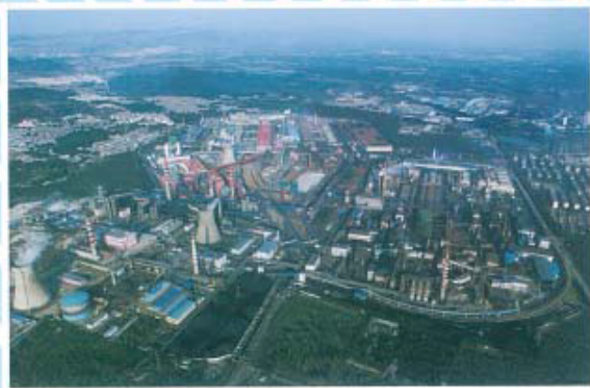
集团公司全景航拍