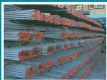
螺纹钢 (英标、加标、日标)