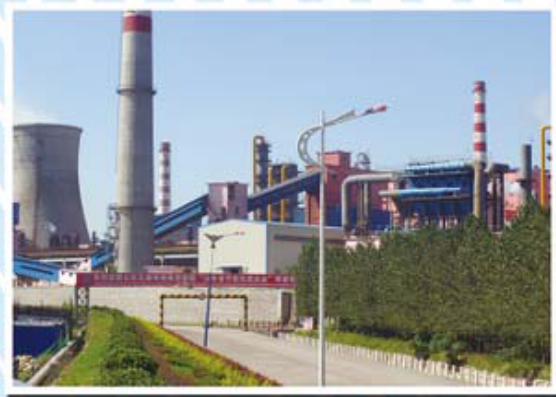
国内先进捣固焦技术焦炉外景