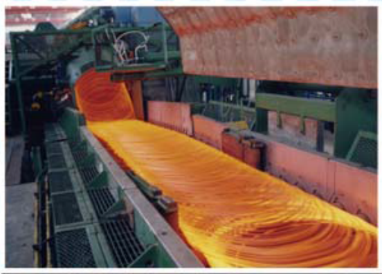
美国摩根公司制造高线吐丝机