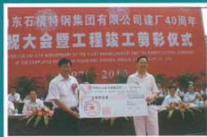
向社会捐助 100 万元助学资金