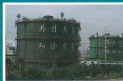
坐落在绿树丛中的煤气柜