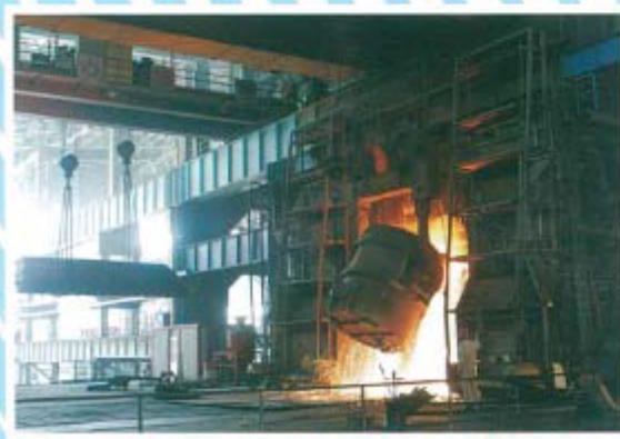
国内先进水平转炉炼钢生产线