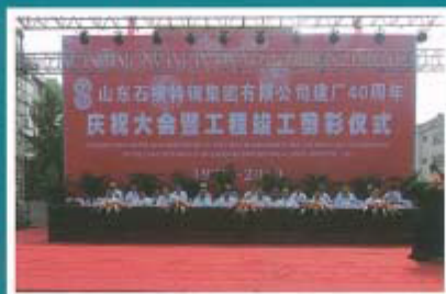
建厂 40 周年庆祝大会 暨工程竣工剪彩仪式