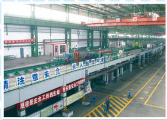
由美国引进世界领先水平高速线材生产线

MODERNIZED STEEL ROLLING SYSTEM AND COKE MAKING SYSTEM