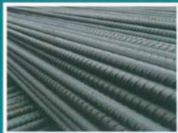
矿用树脂锚杆钢筋