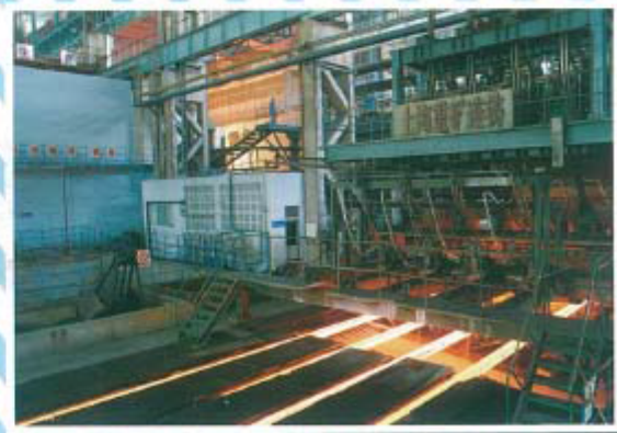
四机四流方坯连铸机