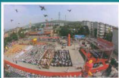
建厂 40 周年庆祝大会会场

ENTERPRISE CULTURE AND THE CIRCULATION ECONOMY